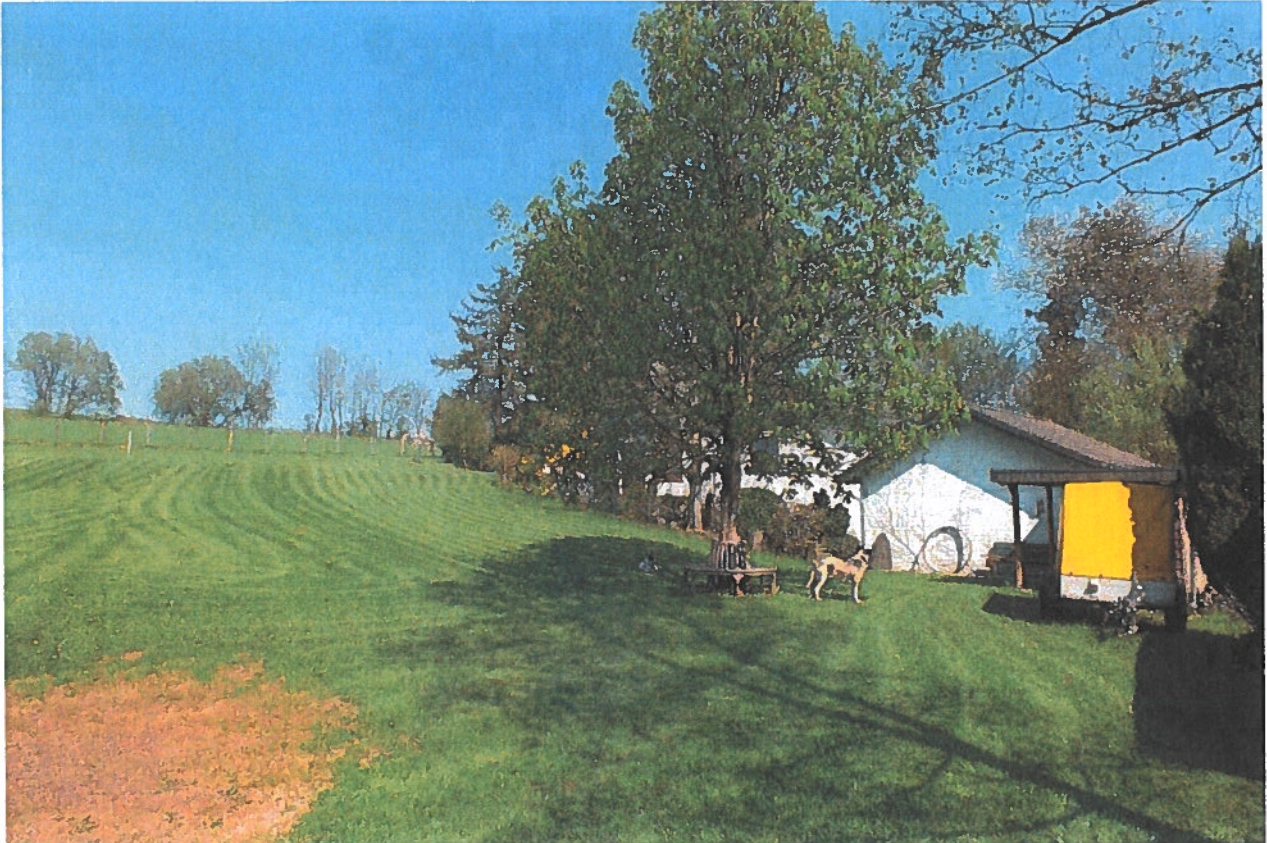
Foto 1: Blick auf den als Scherrasen intensiv genutzten Garten mit Rosskastanie und spielenden Hunden