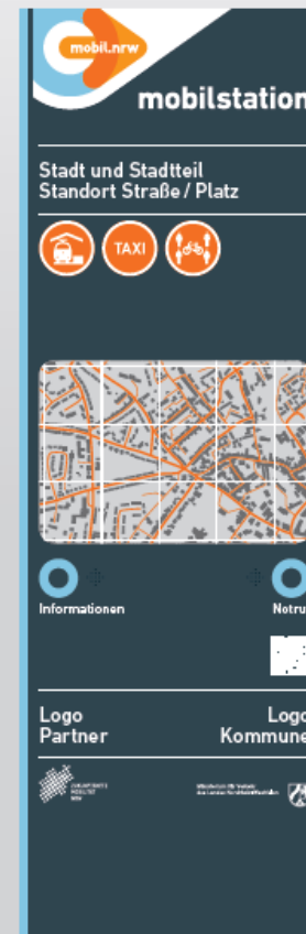
► Vorschlag A1.3 – Individuallösung z. B. ortsansässiges Verkehrsunternehmen